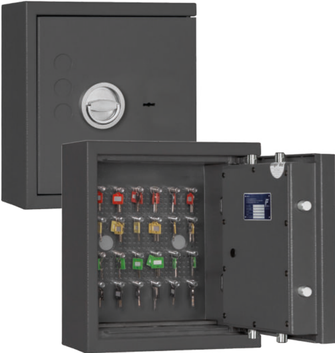
STL 24 Graphitgrau • graphite grey Dekoration nicht im Lieferumfang enthalten • decoration not included in the delivery

🇩🇪 Schlüsseltresor / Wertschutzschrank gem. Widerstandsgrad 0 nach EN 1143-1. Ideal geeignet zur sicheren Verwaltung von bis zu 24 Schlüsseln, Autoschlüsseln oder Schlüsselbunden. Mit 24 Aufnahmebolzen zur variablen Sortierung von Schlüsseln. Optimal zur Wandmontage geeignet.